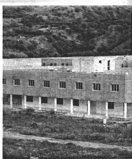
Il penitenziario di Arghillà (Reggio) sarà ampliato

Su questo sfondo s'inserisce il capitolo degli stranieri. Su 1200 detenuti che ogni mese varcano i cancelli dei penitenziari la maggioranza non ha carta d'identità italiana: «Proprio ieri - conferma Durante - ho visitato il carcere di Rossano. Su 300 reclusi 85 sono stranieri. Come sindacato vogliamo spronare il Governo a rafforzare le misure alternative per pene al di sotto dei tre anni e reati che non suscitano allarme sociale. E poi c'è il nodo del braccialetto elettronico. È previsto ma nessun magistrato di sorveglianza applica la recente normativa». ♦