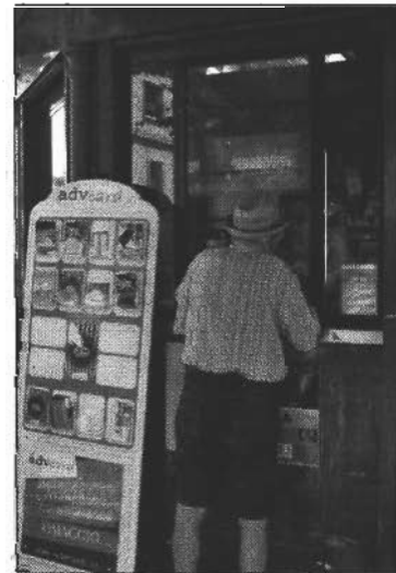
Un passante al centro informativo

E le audio guide? «Non le chiede nessuno, io ne ho in dotazione solo tre ma due sono a casa sotto carica. Con una cartarra di 10 euro, è possibile ricevere informazioni, ma nessuno le vuole».